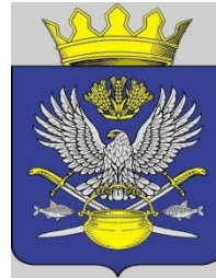
Схема размещения рекламных конструкций на территории Котельниковского муниципального района Волгоградской области

УТВЕРЖДЕНО постановлением администрации Котельниковского муниципального района Волгоградской области от 22.10.2020 г. № 668