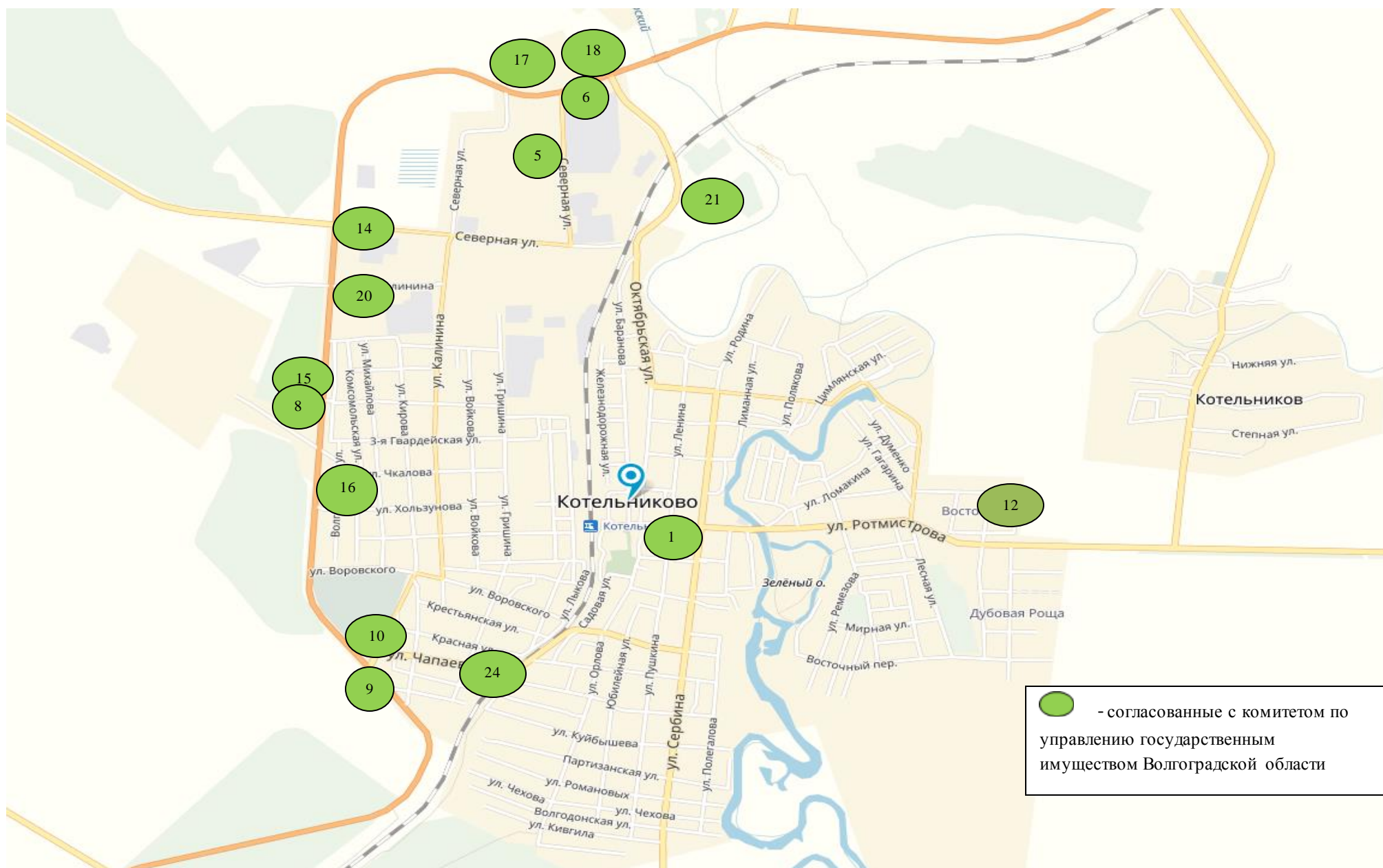
Схема расположения рекламных конструкций г. Котельниково Волгоградской области